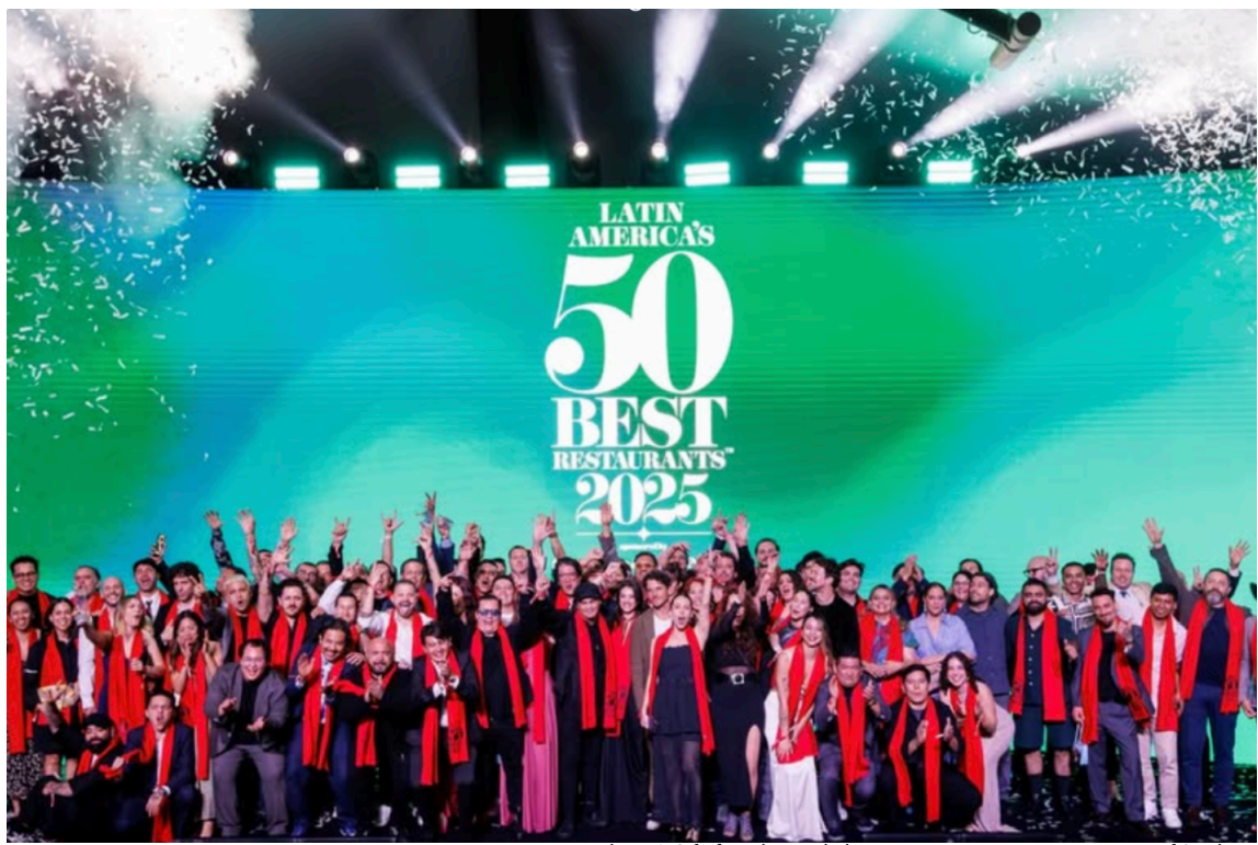
Figura 6: Gala de Latin America's 50 Best Restaurants 2025