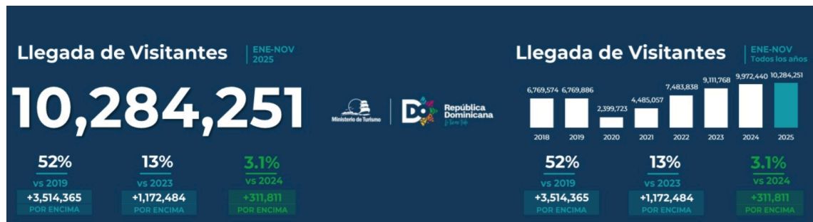
Figura 4: Guillermo y Máxima de Holanda en Surinam.