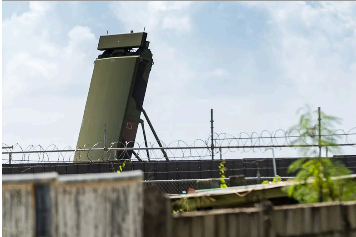
Figura 1: Radar estadounidense instalado en el Aeropuerto Internacional ANR Robinson, Crown Point (Trinidad y Tobago).