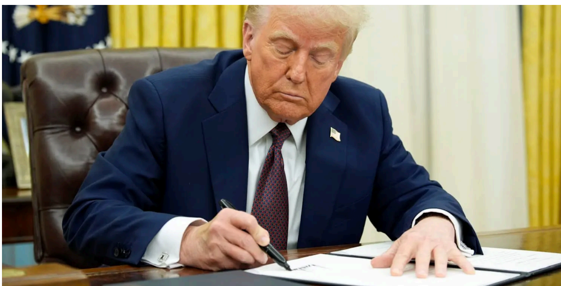
Figura 1: Donald Trump en firma de decretos