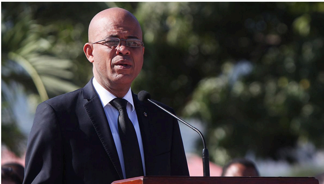
Figura 4: Michel Martelly

En Cuba , la crisis cada vez estrangula más al gobierno: