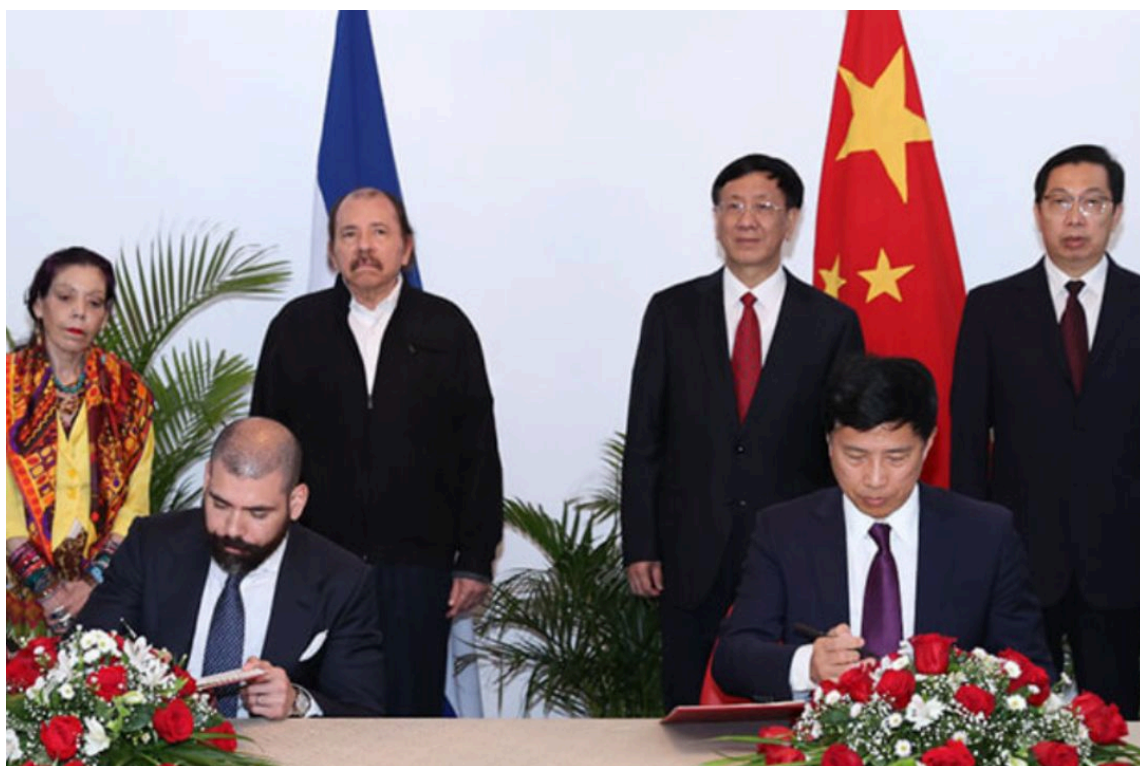
Figura 2: Relaciones diplomáticas entre China y Nicaragua.