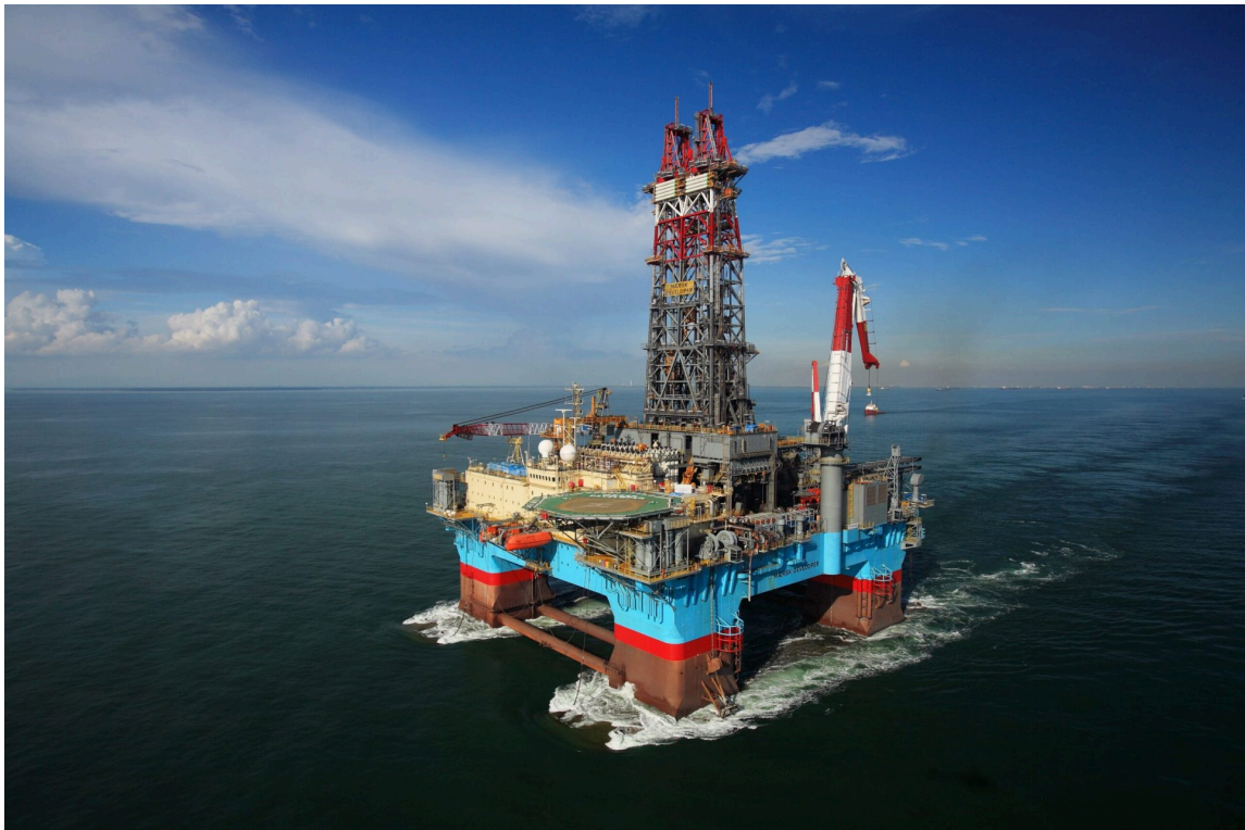
Figura 3: Plataforma de Maersk operando en la cuenca de Guyana Surinam en pleno "boom" petrolero.