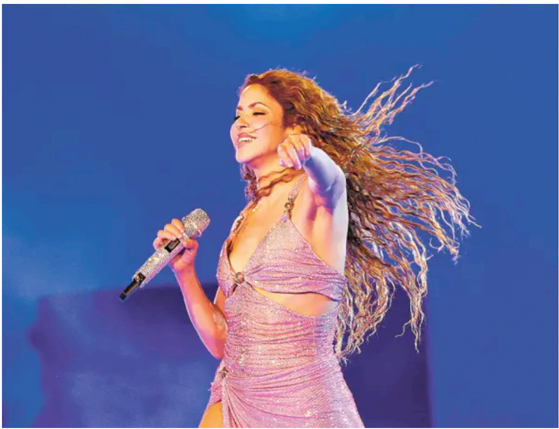
Figura 4: Shakira en la gira latina más grande de 2025: "Las mujeres ya no lloran World Tour"