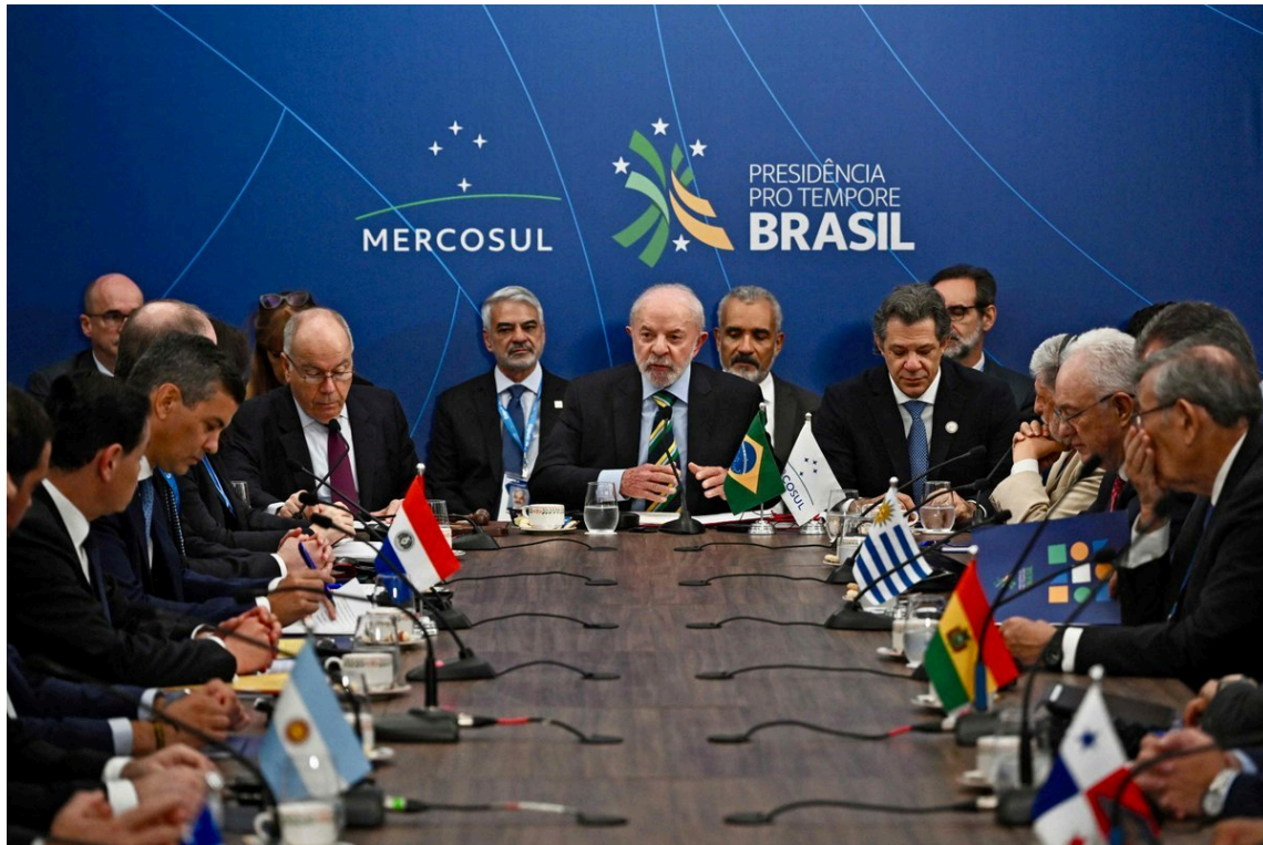
Figura 1: Presidente de Brasil, Luiz Inácio Lula da Silva, durante una cumbre con sus homólogos del Mercosur.

• El canciller panameño Javier Martínez-Acha reveló que los buques con bandera panameña interceptados por Estados Unidos en aguas internacionales, frente a las costas de Venezuela, incumplieron las normas del abanderamiento de naves .