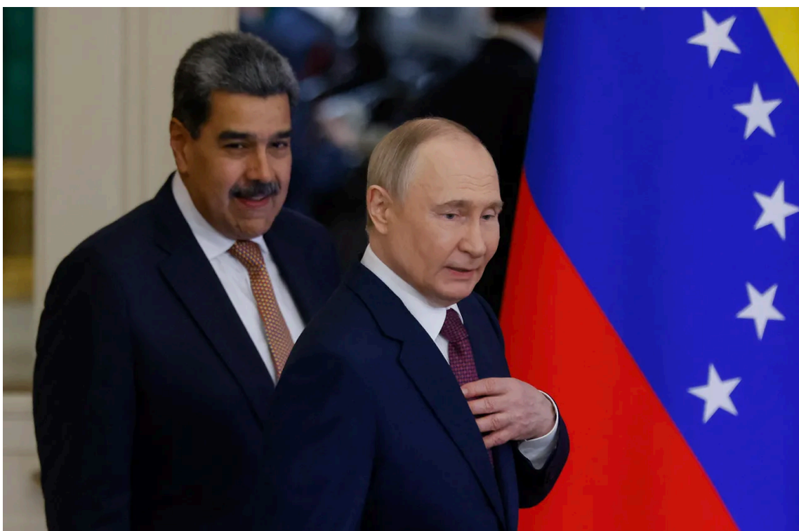
Figura 1: Nicolás Maduro y su aliado Vladimir Putin