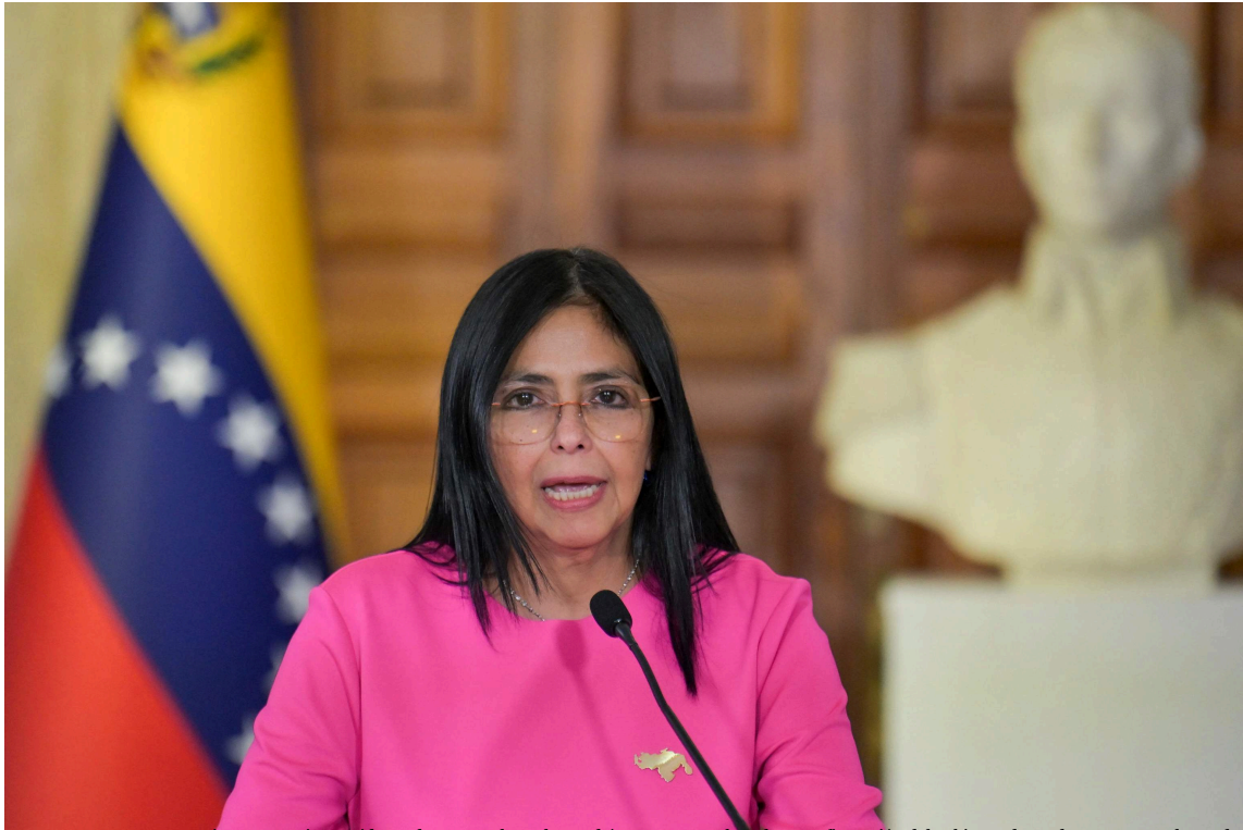
Figura 1: La vicepresidenta de Venezuela, Delcy Rodríguez, que encabeza la reconfiguración del gobierno de Maduro.