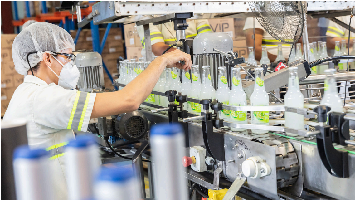
Figura 4: Fábrica del grupo Licores de Guatemala (GLG)

Para cerrar, si quiere escuchar dos podcasts interesantes: