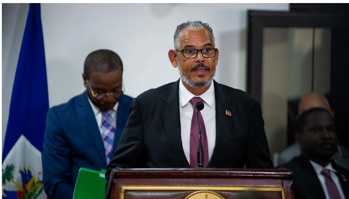
Figura 2: Alix Didier Fils-Aimé

En Honduras, Salvador Nasralla ha reconocido su derrota en las elecciones y ha anunciado ya su candidatura para las de 2029.