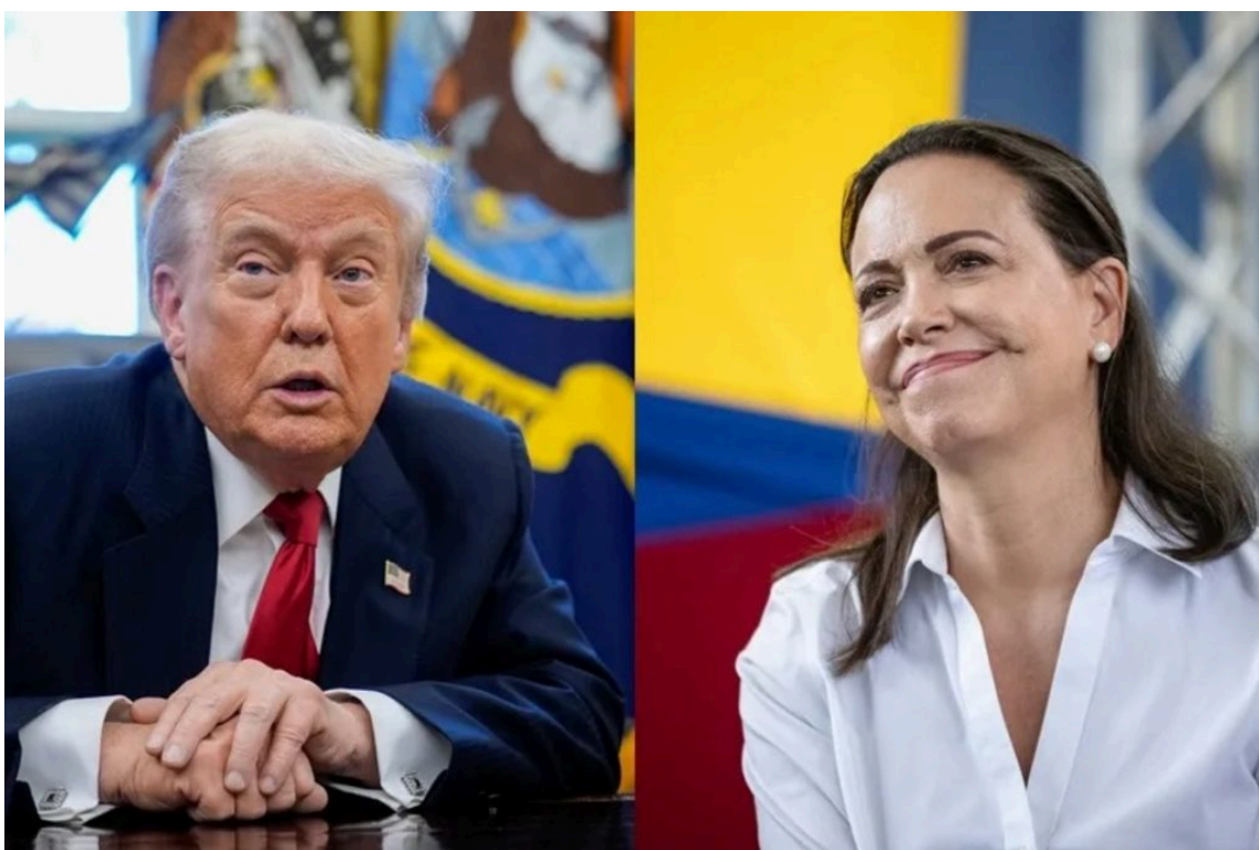
Figura 1: Donald Trump (izquierda) y María Corina Machado (derecha)