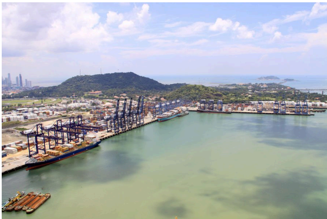
Figura 1: Puerto Balboa, Canal de Panamá