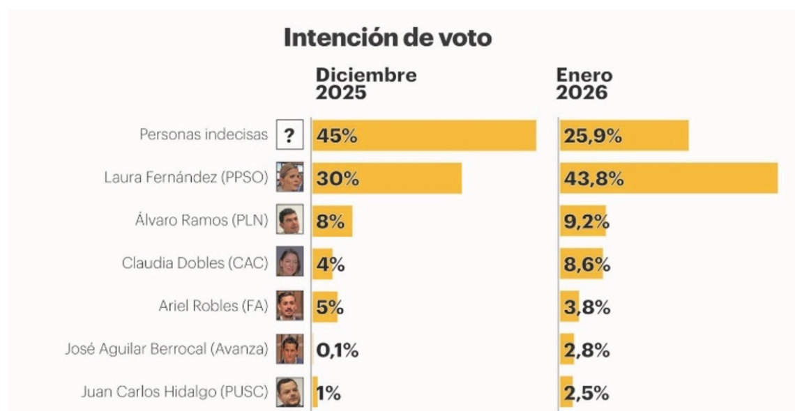
Figura 2: Encuesta de Opinión Pública