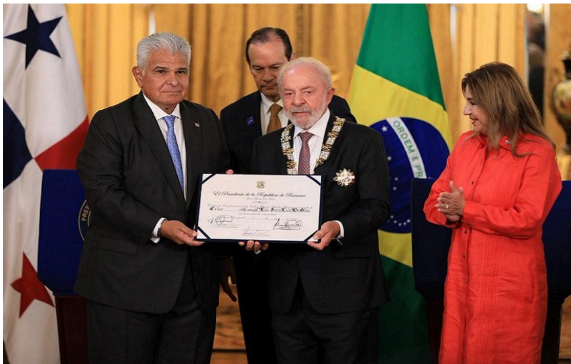
Figura 3: José Raúl Mulino y Luiz Inácio “Lula” da Silva en una ceremonia y reunión de trabajo en el Palacio de las Garzas