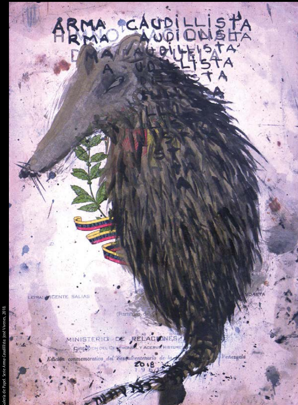
Galería de Papel. Serie Arma Caudillista. José Vivencos, 2018.

CENTRO GUMILLA ■ Estudios venezolanos de comunicación ■ 3° y 4° trimestre 2022