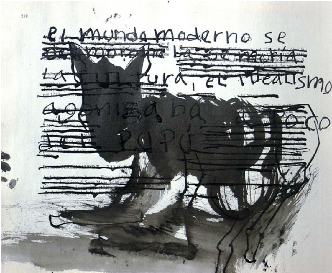
Galería de Papel. Serie Post. s. XIX. José Vives, 2018.